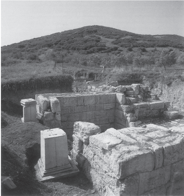
Το νότιο τείχος με τη δυτική πύλη και τα βάθρα ανδριάντων του αυτοκράτορα Αυγούστου και του Καλπόρνιου Πείσωνα

Ήταν από τις πρώτες πύλες του μεγάλου τείχους της Αμφιπόλεως κοντά στο χαράκωμα. Η πύλη αυτή συνδεόταν στη ρωμαϊκή εποχή με την Εγνατία οδό.