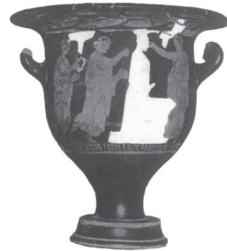
Ερμαϊκή στήλη Διονύσου (Σε ερυθρόμορφο κρατήρα της Αμφίπολης)