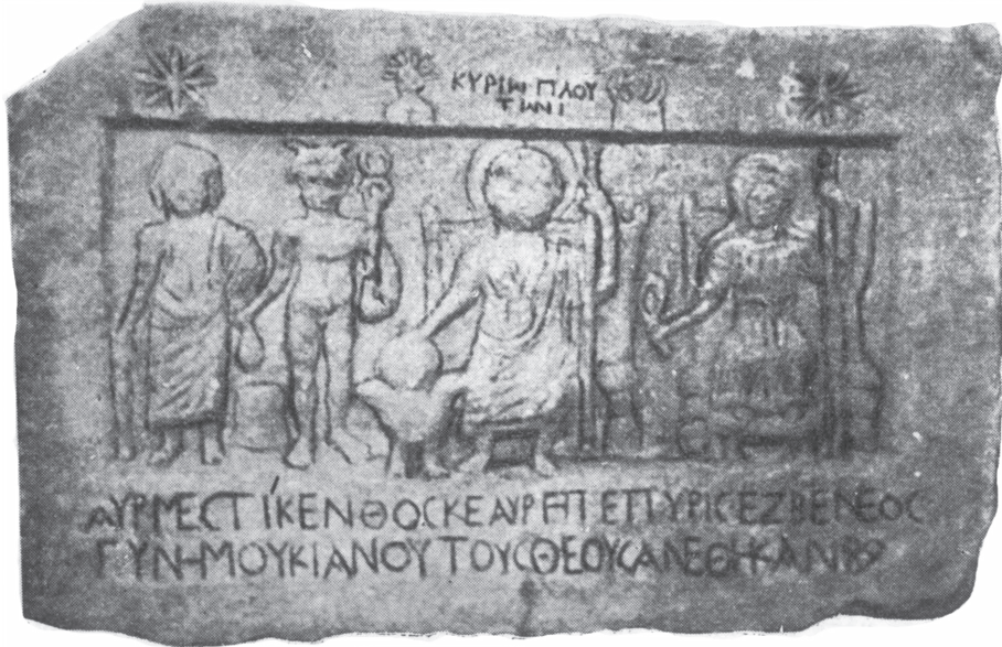
Πλούτωνα και Περσεφόνη ως κριτές των ψυχών των νεκρών

Ο Πλούτωνα και η Περσεφόνη λατρεύονταν ιδιαίτερα στην περιοχή του νομού Σερρών. Αυτό φαίνεται και από ένα σπάνιο αρχαίο ανάγλυφο, διαστάσεων 0,53Χ0,83 μ. που φυλάσσεται στο Μουσείο των Σερρών. Η παράσταση είναι σύνθετη ανάγλυφη με τους θεούς του Άδη, τον Πλούτωνα και την Περσεφόνη. Αριστερά του Πλούτωνα είναι μια Άρπις και γυμνός ο ψυχοπομπός Ερμής. Φέρνει έναν άνθρωπο στον Άδη, μια ψυχή, για να την κρίνουν οι θεοί του Άδη. Πάνω έχει αστέρια και δύο μικρές μορφές με την επιγραφή «ΚΥΡΙΩ ΠΛΟΥΤΩΝΙ».