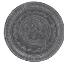
Κεφάλι Μέδουσας (Ανάγλυφο σε σκέπαστρο πλήνιου αγγείου της Αμφίπολης)

Πολλοί γλύπτες εργάστηκαν για τα παραπάνω έργα τέχνης, αλλά δυστυχώς κανένα όνομα αυτών δεν διασώθηκε στην ιστορία της Αμφιπόλεως. Πολλά έργα τέχνης, αγάλματα και ανδριάντες στόλιζαν τους δρόμους, τα δημόσια