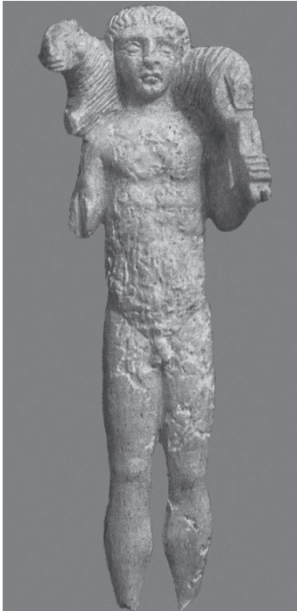
Ελεφάντιο αγαλμάτιο κριοφόρου νέου

β) Τα πολύχρωμα πήλινα ειδώλια θεών, δαιμόνων, ζώων, όπως π.χ. της Αφροδίτης, των ερωτιδέων, των νεκρικών δαιμόνων.