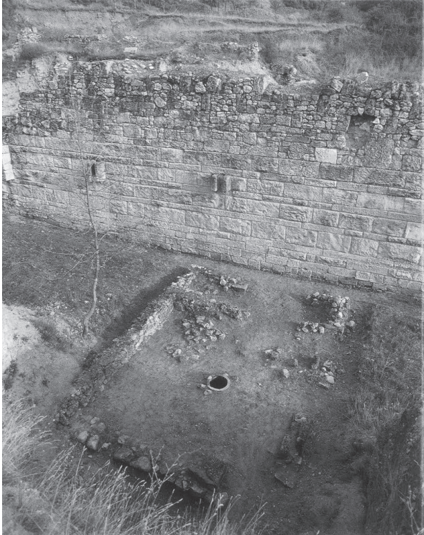
Το βόρειο τείχος της Αμφιπόλεως

Στην πλατιά κορυφή του λόφου η ακρόπολη καταλάμβανε μεγάλη έκταση. Περιβαλλόταν από ιδιαίτερο τείχος. Η ανατολική πλευρά του λόφου στερούνταν φυσικής οχύρωσης. Αναγέρθηκε σ' αυτή ένα μακρύ τοξωτό τείχος, του οποίου τα άκρα κατέληγαν στον Στρυμόνα ποταμό. Από την πλευρά του Στρυμόνα η πόλη προστατευόταν στην αρχή από το υδάτινο τείχος του Στρυμόνα, αλλά επειδή ήταν ευκολοδιάβατος ο Βρασίδας κατασκεύασε δύο νέα παράλληλα τείχη που συμπεριέλαβαν το προάστιο μαζί με τη γέφυρα του Στρυμόνα. Το χρονικό της οχυρώσεως του τείχους έχει ως εξής: