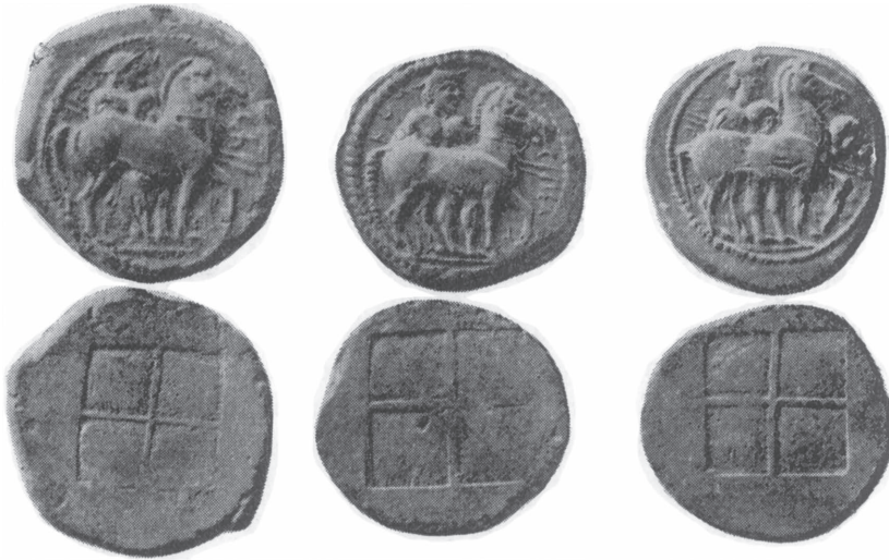
Ασημένια εξάδραχμα Βισαλτών

Από αρχαιοτάτων χρόνων η γονιμότητα της περιοχής προσείλκυε πολλούς αποίκους μετανάστες. Ήταν πλούσια σε μεταλλεύματα, ξυλεία και κτηνοτροφία, ενώ είχε επίσης μεγάλη παραγωγή από αμπέλια, ελιές, σύκα, δημητριακά και λινάρι. Από τον 7 ο αιώνα π.Χ. ιδρύθηκαν ελληνικές αποικίες στα παράλια αυτής. Πολύ νωρίς μοιράστηκαν οι Βισάλτες τον πολιτισμό τους με τους γύρω λαούς.