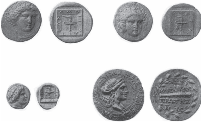
Χρυσά και αργυρά τετράδραχμα Αμφιπόλεως

Η εγκατάσταση του βασιλικού νομισματοκοπείου στην Αμφίπολη και η έκδοση πλουσίων σειρών χρυσών και αργυρών νομισμάτων, καθώς και η επεξεργασία πολλών χρυσών κοσμημάτων μεγάλης τέχνης και αξίας αποδεικνύει ότι η Αμφίπολη ήταν πολύ προηγμένη στη νομισματοκοπεία. Ως κληρονόμος του αθηναϊκού πολιτισμού εξέδωσε τα καλύτερα νομίσματα. Η νομισματοκοπεία της σε όλες τις ιστορικές περιόδους έφθανε στο βαθμό της τελειότητας. Τα νομίσματά της θεωρούνταν ως τα ωραιότερα του αρχαίου κόσμου. Από το 424 π.Χ., οπότε ανεξαρτητοποιήθηκε από την Αθήνα, μέχρι το 358/7 π.Χ. τα αργυρά της νομίσματα ακολουθούσαν το «θρακικό» ή το «φοινικικό» μετρικό σύστημα. Χωρίζονται σε τετράδραχμα, δραχμές, τετρώβολα και