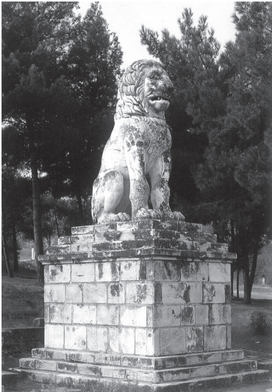
Το μαρμάρινο Λιοντάρι της Αμφιπόλεως

Από τα μνημεία της Αμφιπόλεως, το μόνο που αναστηλώθηκε είναι ο μαρμάρινος Λέοντας της Αμφιπόλεως που στέκεται σήμερα πάνω στο βάθρο του αγέρωχου και επιβλητικός σε ύψος 5,30 μ. για να διηγείται με τη σιωπή του το μεγαλείο της αρχαίας Αμφιπόλεως. Είναι σε στάση καθισμένου πελώριου αίλουρου με όρθια τα μπροστινά του πόδια. Όταν το προσέξει κανείς, διαπιστώνει ότι είναι έργο τέχνης που επιβάλλεται με τον όγκο του και τις ανατομικές του τεχνικές λεπτομέρειες στην πλούσια χαίτη, στο ρύγχος, στις φλέβες, στο τραβηγμένο προς τα πλάγια στόμα του, στις βαθιές κόγχες των ματιών του και γενικά στο δυναμικό παρυσιαστικό του 194 .