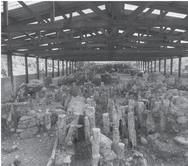
Η γέφυρα του Στρυμόνα με τους απολιθωμένους πασσάλους

Ο Ξέρξης δεν βρήκε γέφυρα στον Στρυμόνα. Οι μάγοι του πριν φθάσουν στον ποταμό τέλεσαν μαγικές ιεροπραξίες. Έσφαξαν προς τιμήν του Στρυμόνα λευκά άλογα. Ζητούσαν με τις θυσίες καλούς οιωνούς. Προχώρησαν προς τις γέφυρες στο μέρος των Εννέα οδών που είναι η χώρα των Ηδωνών και βρήκαν τον ποταμό ζευγμένο. Φαίνεται ότι ο Ξέρξης έστειλε συνεργεία και «προσετέτακτο και τον Στρυμόνα ποταμόν ζεύξαντας γεφυρώσαι». Ο πολυπληθής στρατός του βρήκε ζευγμένο τον ποταμό με πολλές γέφυρες και πέρασε σύντομα και άνετα. Προ της διαβάσεως της γέφυρας οι μάγοι, σύμφωνα με τα περσικά έθιμα, έθαψαν ζωντανούς εννέα νέους και εννέα νέες από τους ντόπιους, επειδή έμαθαν ότι η τοποθεσία λέγονταν Εννέα Οδοί 162 . Μετά από τον περσικό πόλεμο κτίστηκαν γέφυρες στον Στρυμόνα από τους Έλληνες. Κατά τον Θουκυδίδη (IV.103) ο Βρασίδης έδωσε εύκολα τη φρουρά των Αθηναίων από τη γέφυρα της Αμφιπόλεως το 424 π.Χ. Αυτό έπεισε τον Βρασίδα να περιτειχίσει την Αμφίπολη και τη γέφυρα του ποταμού Στρυμόνα την ίδια χρονιά. Όταν ο Θουκυδίδης έγραφε την ιστορία του πολέμου Αθηναίων και Σπαρτιατών στην Αμφίπολη «τα τείχη δεν ήταν ως κάτω, όπως