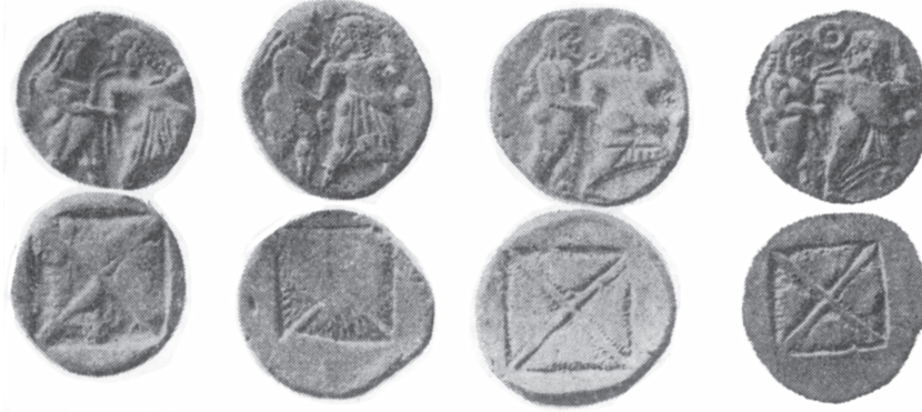
Ασημένια δίδραχμα Σιροπαιόνων

Από τη δράση των Παίωνων του Στρυμόνα αναφέρει ο Ηρόδοτος (V.1-2) την