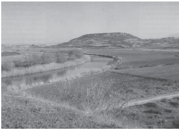
Ο Στρυμόνας προ του λόφου της Αμφιπόλεως

Η συνολική διαδρομή του Στρυμόνα είναι περίπου 250 χιλιόμετρα. Τα 104.500 μέτρα τα διέρχεται από το νομό Σερρών. Για τη διέξοδό του στον κάμπο των Σερρών διασχίζει τα στενά του Κλειδίου σε μήκος 10 χιλιομέτρων. Η παροχή του νερού ανά δευτερόλεπτο κυμαίνεται ανάλογα με τα χιόνια του χειμώνα και τη συχνότητα και την ποσότητα των βροχοπτώσεων. Η μεγαλύτερη παροχή νερού και προσχώσεων ανήλθε στα 2.987 κ.μ. ανά