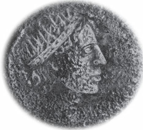
Χάλκινο νόμισμα με την κεφαλή του θεοποιημένου Στρυμόνα

φαρδιά σε ορισμένα μέρη 21 . Για να τον εξευμενίσουν τον λάτρευαν ως θεό. Σε χάλκινα νομίσματα της ρωμαϊκής εποχής τον εικονίζουν ως άνδρα ημίγυμνο χωρίς γένια. Στεφανωμένος κάθεται στη γη κρατώντας με το δεξί χέρι καρπό αφιονιού και δύο στάχια.