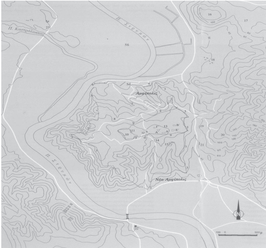
Διάγραμμα (χάρτης) της αρχαίας Αμφιπόλεως

Η οικονομία στηριζόταν στη γεωργία της, στον «εύκαρπο πυλώνα», όπως χαρακτηρίζει ο Στράβων (II.7, 36) τον κάμπο της με τον διαρρέοντα αυτόν Στρυμόνα. Ήταν η γνωστότερη από όλες τις πόλεις της περιοχής της Μακεδονίας στα μακεδονικά και τα ρωμαϊκά χρόνια. Ήταν η εστία του Ελληνισμού στην περιοχή αυτή για πολλούς αιώνες.