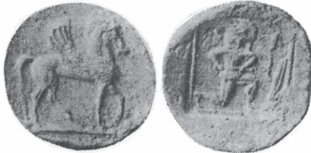
Ασημένιο νόμισμα Κρηστωναίων

Την Κρηστωνία, όπως και τη Βισαλτία, τις κατέλαβε κατόπιν μάχης ο Αλέξανδρος Α΄ των Μακεδόνων, ο φιλέλληνας. Οι κάτοικοί τους αφομοιώθηκαν στο μακεδονικό κράτος. Λάτρευαν το θεό Μάμερτον που ταυτίζονταν με το θεό Άρη των Θρακών.