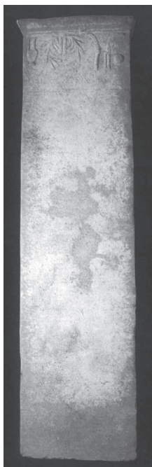
Ο εφηβαραρχικός νόμος

Στην είσοδο της στοάς βρέθηκε πεσμένη από το βάθρο της μια μεγάλη, ύψους 2,65 μ., ενεπίγραφη στήλη με 139 στίχους. Περιέχει τον εφηβαραρχικό νόμο του εφηβάρχου Αδαίου Ευημέρου. Για να γραφεί ο εφηβαραρχικός νόμος κωδικοποιήθηκαν οι παλαιές διατάξεις και τα βασιλικά διατάγματα που αναφέρονταν στους νέους. Γράφτηκε κατά το τελευταίο τέταρτο του 1 ου αιώνα π.Χ.. Στη βάση απεικονίζονται ανάγλυφα τα σύμβολα της παλαιστρας και των άλλων αθλημάτων, ήτοι στεφάνι ελιάς, κλαδί φοίνικα, σπλεγγίδα, σφαίρα, δίσκος και αγγείο.