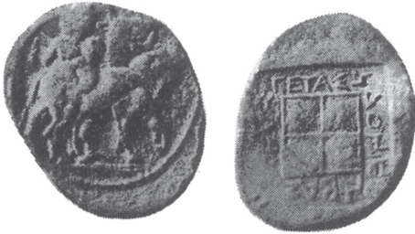
Ασημένιο εξάδραχμο Ηδωνών

β) Ο Γέτας ήταν βασιλιάς των Ηδωνών προ του 500 π.Χ. Βρέθηκαν αργυρά εξάδραχμα και δεκάδραχμα νομίσματα του 520 ως 480 π.Χ., με την επιγραφή «ΓΕΤΑΣ ΒΑΣΙΛΕΥΣ ΗΔΟΝΕΩΝ». Εικονίζεται στο νόμισμα ένας όρθιος γυμνός γενειοφόρος με πέτασο άνδρας ανάμεσα σε δύο βόδια που βαδίζουν 124 .