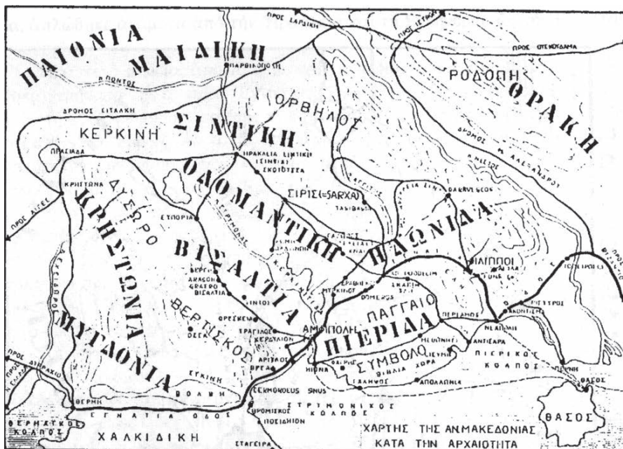
Χάρτης της Ανατολικής Μακεδονίας στους αρχαίους χρόνους