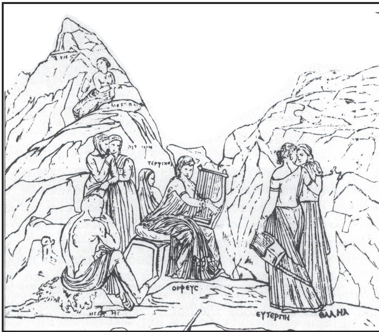
Ο Ορφέας παίζει λύρα μπροστά στις Μούσες

βουνά χωρίς να περιγράψει την ακριβή θέση του: «Το δε μαντήιον τούτο έστι επί των ορέων των υψηλοτάτων, Βύσσοι δε και Σάτρες εισί οι προφητεύοντες του ιερού, προμάντις δε η χρέωσα καθ' άπερ εν Δελφοίσι και ουδέν ποικιλότερον». Σε ποια όμως βουνά; Στο Παγγαίο ή στο Μενοίκιο όρος; Ο ίδιος ιστορικός εξομοιώνει το μαντείο αυτό με εκείνο των Δελφών, γράφοντας ότι «μία προμάντις δίδει τους χρησμούς όπως στους Δελφούς». Επομένως και εδώ υπήρχε ναός και σπηλιά με το άγαλμα του Διονύσου και μπροστά στο άγαλμα άναβε φωτιά με φύλλα δάφνης. Σε κάποιο σημείο της σπηλιάς υπήρχε τρίποδας και μια μάντισσα ζαλισμένη από τους καπνούς, σε κατάσταση εκτός εαυτού, έλεγε παραληρήματα από τα οποία οι Βύσσοι και οι Σάτρες θα έβγαζαν ένα αμφισβητήσιμο νόημα.