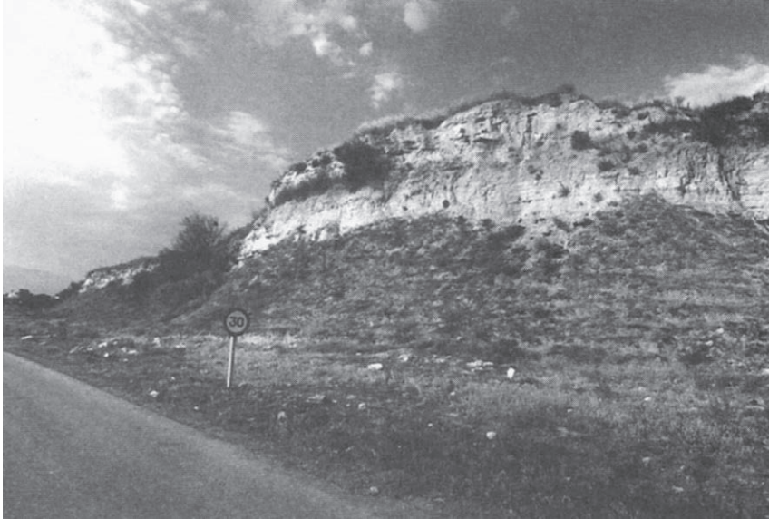
Οι παλιές όχθες της λίμνης, στη δυτική άκρη του αρχαίου οικισμού

Βόλβης, 4) του Αχινού, 5) της Κερκινίτιδας (Μπούτκοβου) και 6) της Δοϊράνης. Οι προσδιοριστικές αναφορές του Ηροδότου, σύμφωνα με τις οποίες η Πρασιάδα λίμνη ήταν ανάμεσα στα όρη Δύσωρο, όπου βρίσκονταν τα μεταλλεία αργύρου, και τον Όρβηλο, από τον οποίο έκοβαν τα παλούκια, τους στύλους για να στηρίξουν τα πατάρια των λιμνήσιων κατοικιών, αποκλείει τις τέσσερις μακρινές λίμνες των Φιλίππων, του Αγίου Βασιλείου, της Βόλβης και του Αχινού. Οι τέσσερις αυτές λίμνες βρίσκονταν σε πολιτιστικά ανεπτυγμένες και ευκολοδιάβατες περιοχές, που εύκολα θα τις καταλάμβανε ο Ξέρξης. Δεν ήταν απομονωμένες όπως η Κερκίνη (του Μπούτκοβου) και η Δοϊράνη, για να δικαιολογούν την πρωτόγονη άμυνα και διαβίωση στον λιμνήσιο οικισμό. Από τις έξι λίμνες μένουν λοιπόν μόνο εκείνες της Κερκίνης και της Δοϊράνης. Περισσότερο από τις δύο ταιριάζει στις περιγραφές η λίμνη του Μπούτκοβου, η Κερκίνη, λόγω της απόμερης και δασώδους περιοχής της. Ήταν δύσκολο να την καταλάβει ο στρατηγός του Δαρείου Μεγάβαζος. Αποπειράθηκε να την καταλάβει, αλλά δεν το κατόρθωσε.