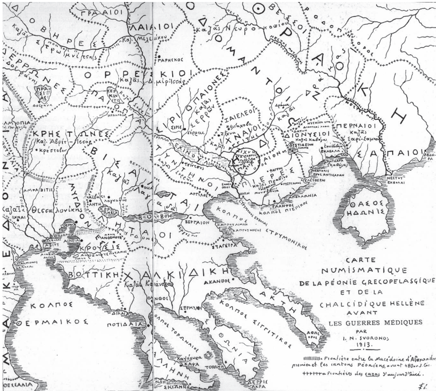
Χάρτης των αρχαίων φυλών της Ανατολικής και Κεντρικής Μακεδονίας

Οι Παίονες κατοικούσαν γύρω από τον Αξιό ποταμό, αλλά οι παιονικές αυτών φυλές, Ηδωνοί και Βισάλτες, ενέμοντο το υπόλοιπο μέρος της χώρας